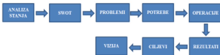
Slika 1. Prikaz povezanosti elemenata LRSR